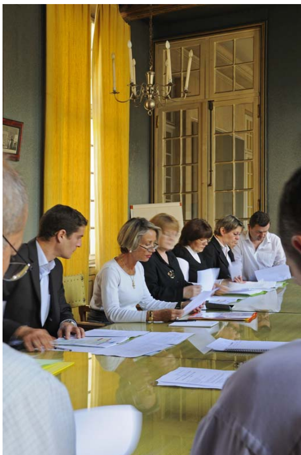
Greffiers en séance de travail autour de la présidente du tribunal

Le magistrat administratif acquiert, dans l'exercice de ses fonctions, des compétences juridiques variées . Il peut s'appuyer, à l'entrée dans le corps, sur une formation initiale de six mois, puis, tout au long de sa carrière, sur un programme diversifié de formation continue (y compris dans des domaines tels que la gestion, l'encadrement, la gestion des ressources humaines...). La diversité du contentieux administratif le conduit à maîtriser des dispositifs juridiques complexes, dans des domaines aussi différents que les libertés publiques, le droit économique (marchés et contrats, fiscalité...), le droit de la fonction publique, l'urbanisme et l'aménagement du territoire, le droit des collectivités territoriales.... Cette variété n'est pas exclusive d'une certaine spécialisation dans les matières les plus complexes, parfois recherchée, jamais imposée, qui fait des magistrats administratifs des praticiens du droit appréciés.