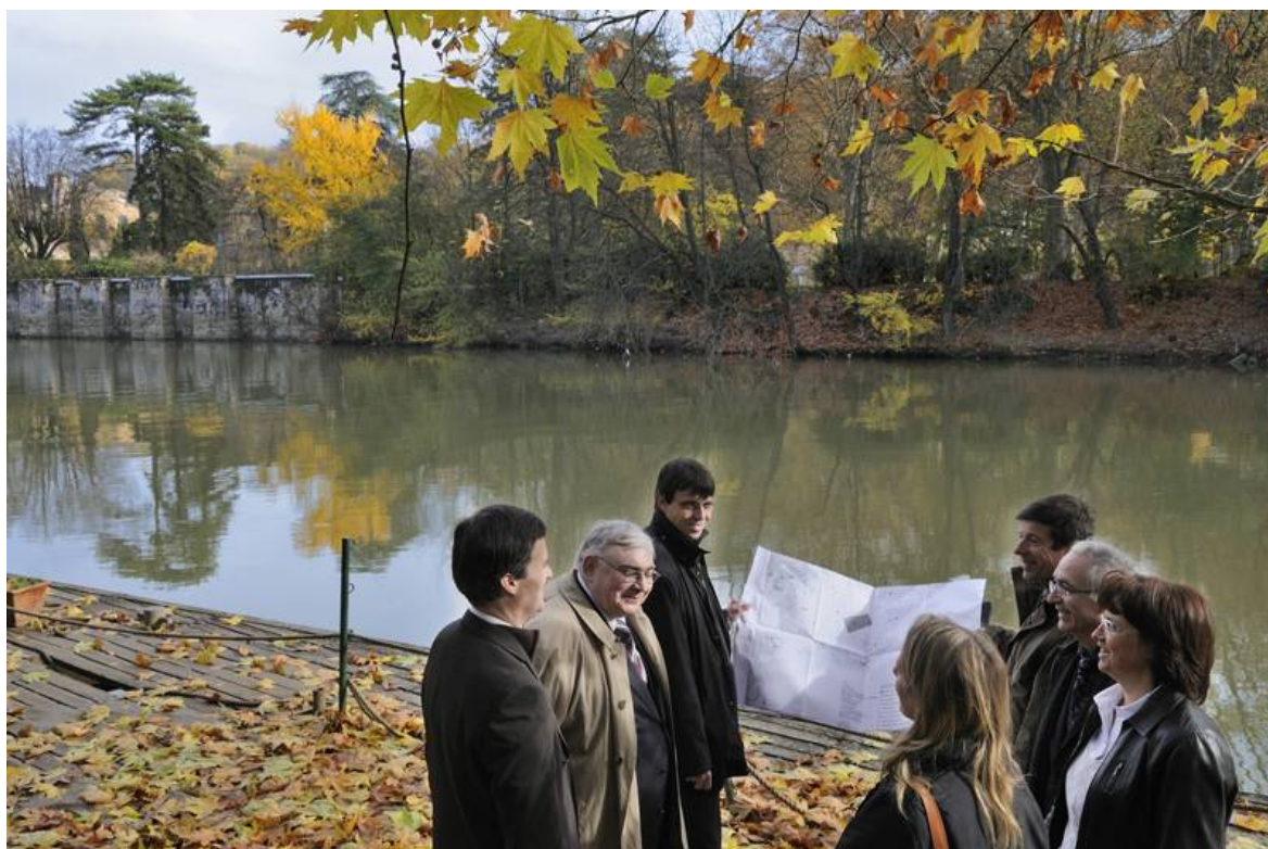
Expertise sur le terrain avant une audience

■ Les magistrats administratifs sont en outre directement associés à l'action de rayonnement de la juridiction administrative . Ils peuvent, à titre individuel, mener des missions de conseil auprès des administrations ou des établissements publics. Ils peuvent également avoir une activité d'enseignement et de publication et être sollicités dans le cadre d'échanges ou de colloques sur des sujets où ils ont acquis autorité. Ils sont systématiquement associés aux actions de rayonnement et de coopération internationale que le Conseil d'Etat développe au niveau de la juridiction administrative dans son ensemble.